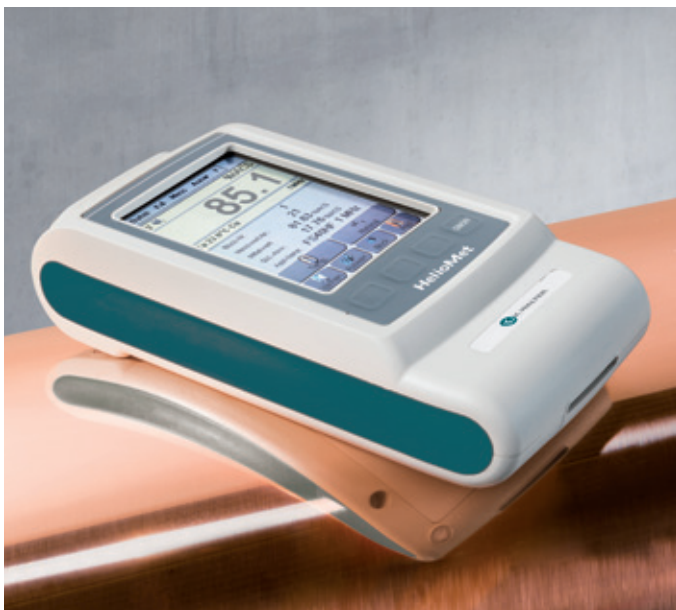
Compact measurement device with clear display Handliches Messgerät mit übersichtlichem Display