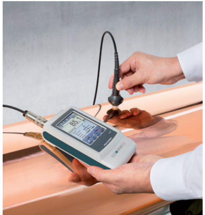
Measurement of a copper cylinder Messung eines Kupferzylinders

K.Walter unterstützt Kunden mit stabilen Prozessen für beste Ergebnisse. Mit eine Voraussetzung dafür: Leistungsfähige Messtechnik, die unter Produktionsbedingungen sichere Ergebnisse liefert und einfach zu bedienen ist. Messgeräte von K.Walter werden für die rasche und zuverlässige Ermittlung von reproduzierbaren Werten entwickelt und leisten damit einen wichtigen Beitrag zur Qualitätssicherung.