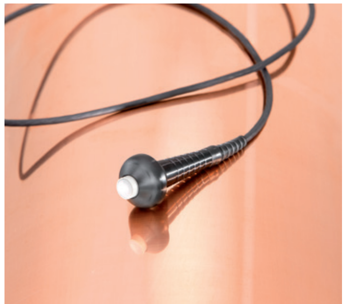
Measuring probe Messsonde